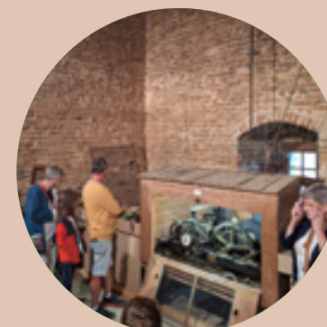
Organisation de Bress'Addict Les Jeudis Insolites Bresse bourguignonne