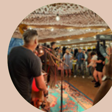
Organisation de Bress'Addict Garçon, La Note! Bresse bourguignonne