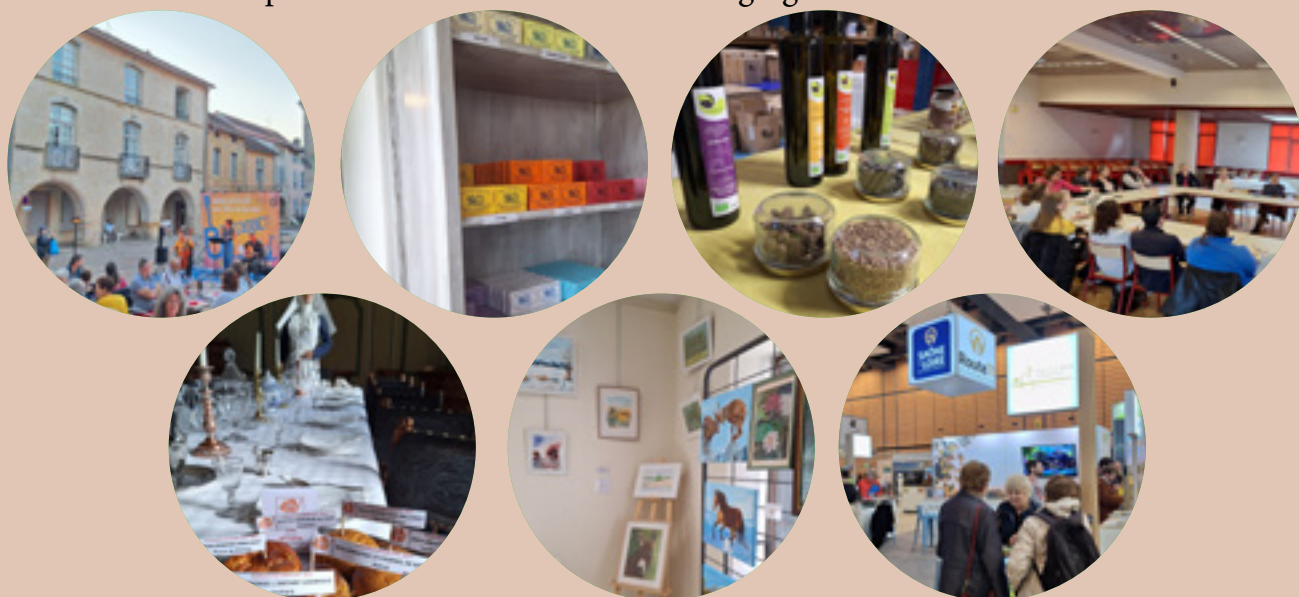
Guide des partenariats 2026