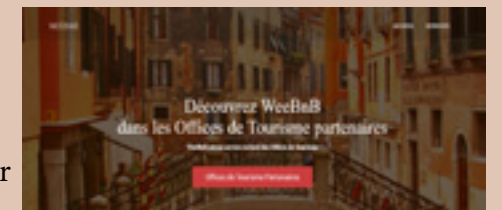
Visuel non contractuel

Solution permettant aux hébergeurs (meublés et chambres d'hôtes) de diffuser leurs disponibilités sur notre site Internet ainsi que celui de la Mission Tourisme du département de Saône-et-Loire et de synchroniser leurs plannings entre les différentes plateformes. En option : l'hébergeur peut bénéficier de la création d'un site Internet pour son hébergement !