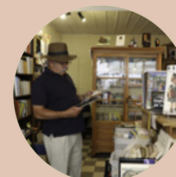
Partenaire du Village du Livre Cuisery