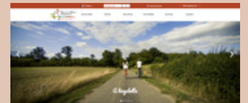
Visuel non contractuel

Avec plus de 183 000 pages vues en 2024, notre site est une porte d'entrée importante pour votre activité. Il se veut informatif, complet et simple d'utilisation ( www.bresse-bourguignonne.com ).