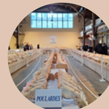
Partenaire des Glorieuses de Bresse Louhans