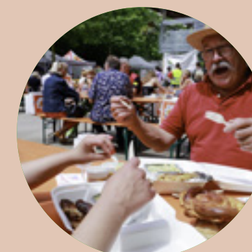
Partenaire de la Fête du Poulet de Bresse Louhans