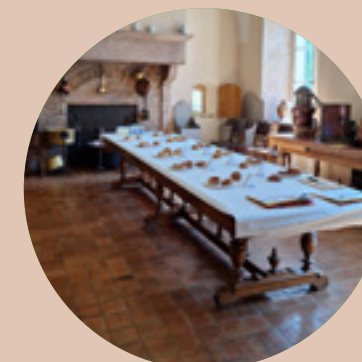
Organisation de la Fête de la Corniotte Bresse bourguignonne