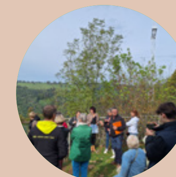
Organisation d'un Eductour pour les partenaires Bresse bourguignonne