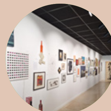
Partenaire de l'Inter-Biennale des Arts Cuiseaux