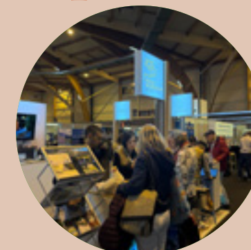
Présence sur les salons Salon du Tourisme et du Voyage Colmar