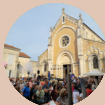
Accueil «Hors les Murs» Foire de la Saint-Simon Cuiseaux