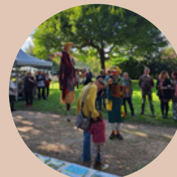
Accueil «Hors les Murs» Fête du Terroir Saint-Germain-du-Bois