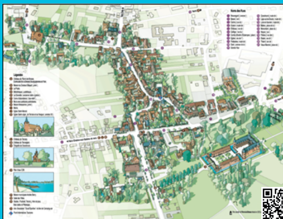
Plan cavalier disponible au Bureau d'Information Touristique ou en scannant ici